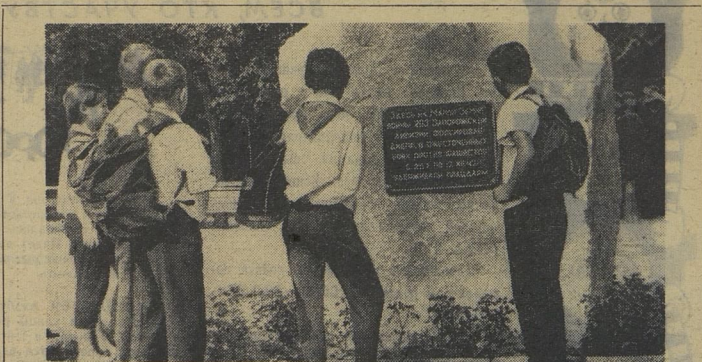
Лето только началось, а ребята из 50-й школы г. Запорожья уже исхолили много туристских троп.

В ходе всеобщей забастовки коммунисты и Федерация левых сил, объединившись, выдвинули лозунг: «За народное правительство демократического единства!»