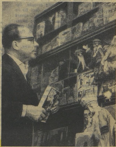
ТВОЯ КНИЖНАЯ ПОЛКА

Обдумываю я эту повесть уже пять лет. Хорошо было бы закончить её к началу будущего года.